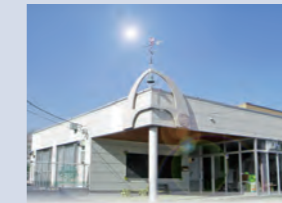
ひがしなえぼ幼稚園