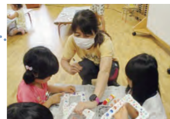
預かり保育士（専任）

特別支援教育コーディネーター 一人一人に応じた支援の検討、 保護者や関係機関等との連携を 推進します