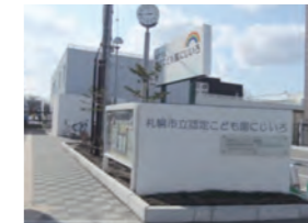
認定こども園にじいろ