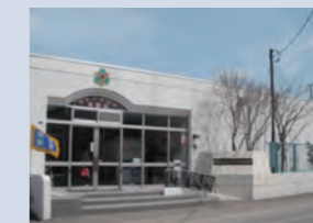
あつべつきた幼稚園