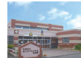
きくすいもとまち幼稚園