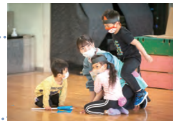
幼稚園教諭・保育教諭